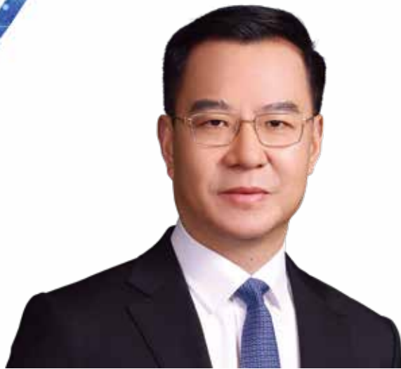
劉烈宏 董事長兼 首席執行官

54歲，研究生，管理學博士，2021年9月起擔任本公司董事長兼首席執行官。劉先生曾任信息產業部電子第二研究所所長，中國電子科技集團副總經理，中國電子信息產業發展研究院院長兼北京賽迪信息產業集團公司總裁，中國電子信息產業集團有限公司董事、總經理，中國電子科技集團有限公司董事、總經理，中央網絡安全和信息化委員會辦公室副主任、國家互聯網信息辦公室副主任，工業和信息化部副部長。第十二屆全國政協委員。劉先生現任第二十屆中央委員會候補委員，中國聯合網絡通信集團有限公司（「聯通集團」），中國聯合網絡通信股份有限公司（「A股公司」）及中國聯合網絡通信有限公司（「中國聯通運營公司」）之董事長。劉先生具有豐富的管理及信息產業從業經驗。